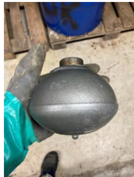
Eks. på fremmedlegemer som kan føre til havari på kverner