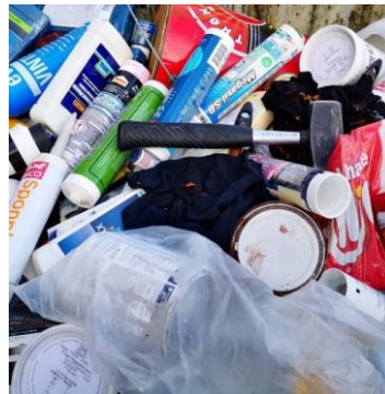
«Søppel» som filler og hammer kan føre til driftsstans