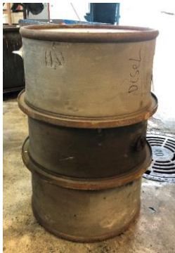
Panserfat kan ikke kvernes