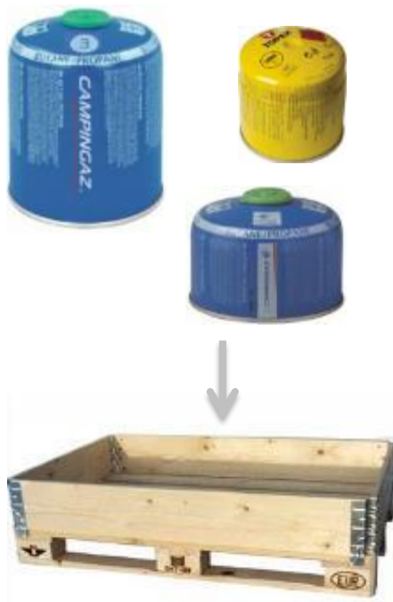
Diameter fra 90 mm til 120 mm