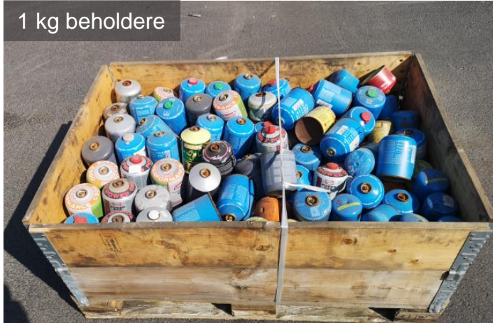
1 kg beholdere